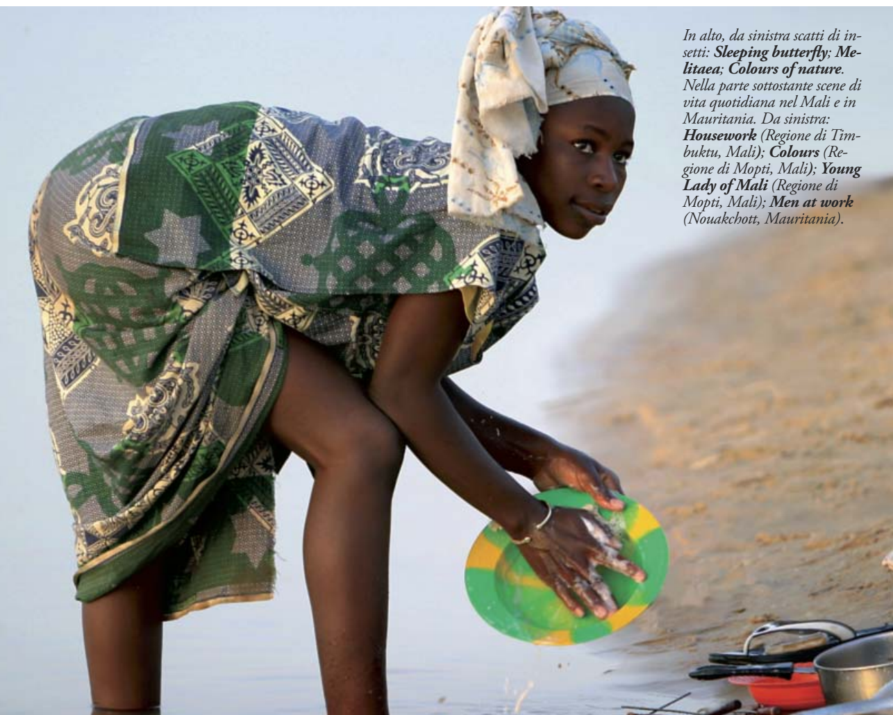
In alto, da sinistra scatti di insetti: Sleeping butterfly; Melitaea; Colours of nature. Nella parte sottostante scene di vita quotidiana nel Mali e in Mauritania. Da sinistra: Housework (Regione di Timbuktu, Mali); Colours (Regione di Mopti, Mali); Young Lady of Mali (Regione di Mopti, Mali); Men at work (Nouakchott, Mauritania).