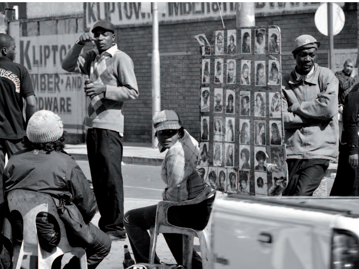
In queste pagine: in alto e a sinistra tre scatti eseguiti in Sudafrica (in alto Capetown e a sinistra Soweto). La foto a destra è stata scattata nello Swaziland