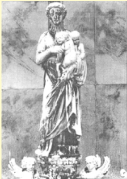
"La Carità" particolare della facciata dell'Ospedale civile di Venezia

Attualmente la biblioteca è visitabile dal lunedì al venerdì dalle 8.30 alle 14, chiusa la settimana di ferragosto e dal 24 dicembre al 1° gennaio.