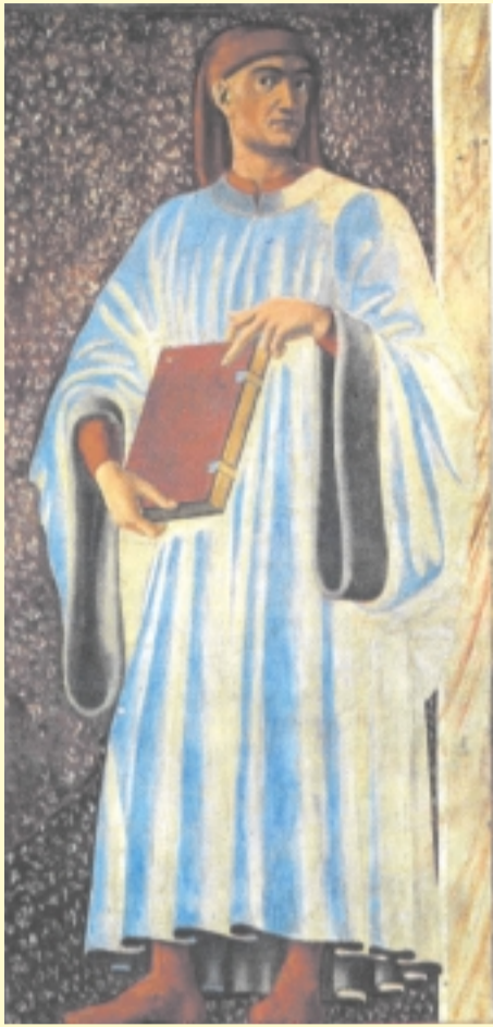
Giovanni Boccaccio, di Andrea Del Castagno