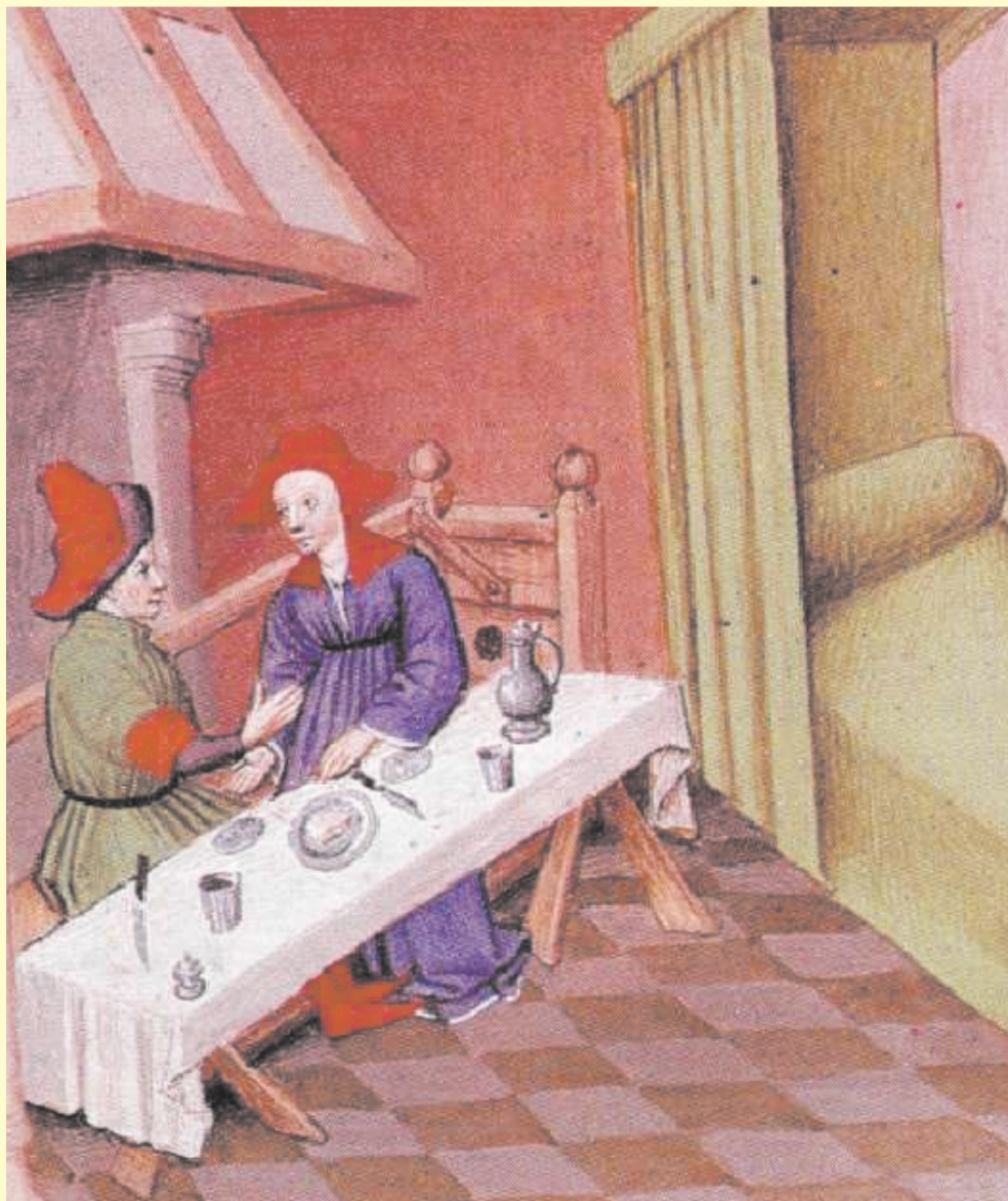
Miniatura con scena dal Decamerone