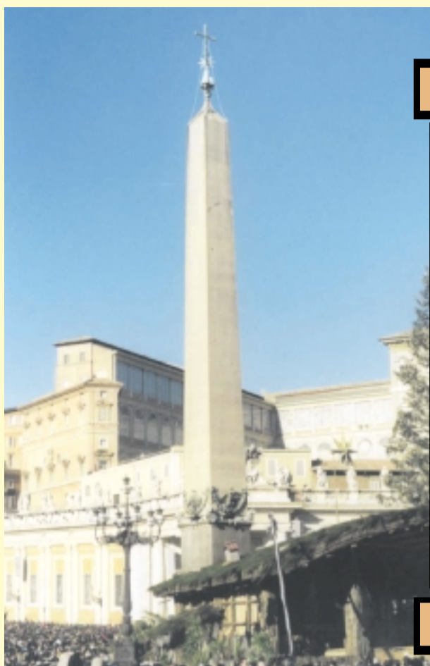
Un pizzico di Egitto in Piazza San Pietro