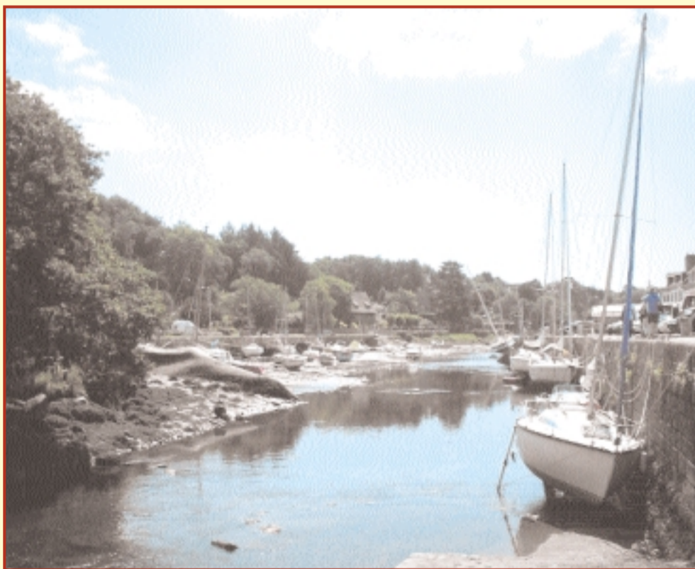
Bassa marea a Pont Aven

Nella parte settentrionale della Cornovaglia, la riserva ornitologica di Cap Sizun ospita colonie di innumerevoli uccelli marini, fra cui alcune specie rarissime. Il centro abitato più importante di questa zona è Douarnenez , importante porto di pesca che ha conservato un quartiere antico praticamente intatto.